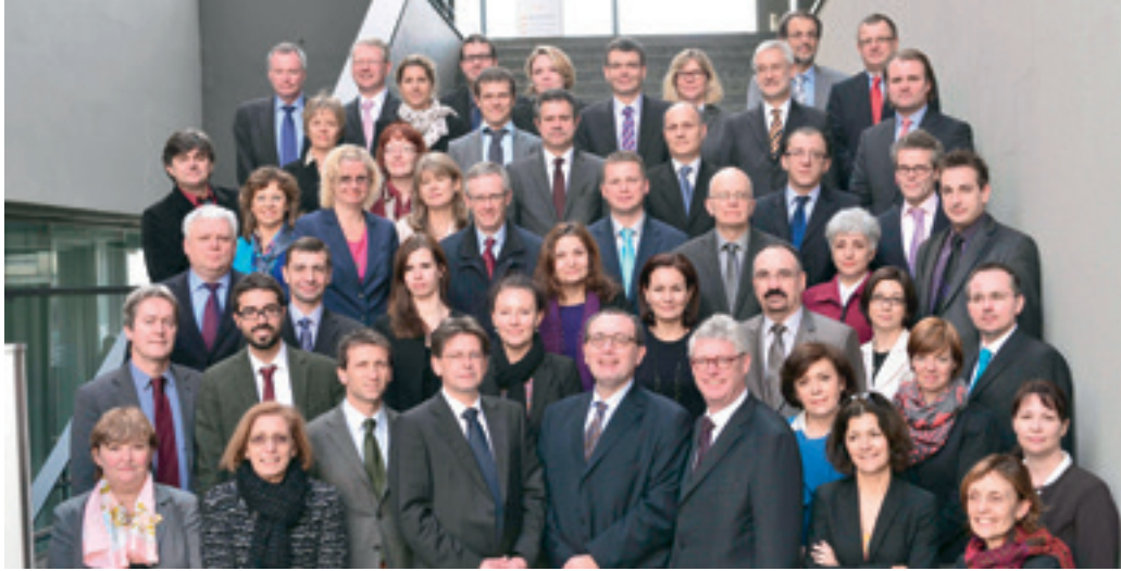
Tiende vergadering van de raad van bestuur van EASO op 4 en 5 februari 2013 op Malta