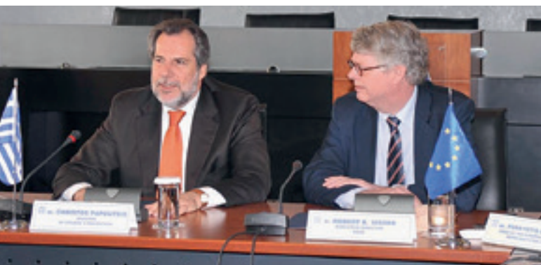
Ondertekening van het operationele plan met Griekenland op 1 april 2011 in Athene

Na een verzoek van de Griekse regering besloot EASO in februari 2011 Griekenland te helpen bij het opzetten van de nieuwe asiendienst, de dienst voor eerste opvang, de beroepsinstantie, de opvang in het algemeen en het wegwerken van de opgelopen achterstanden door de inzet van deskundigen uit de verschillende EU-lidstaten via de zogenoemde asielondersteuningsteams. In de eerste fase van de ondersteuning aan Griekenland, die eindigde in maart 2013, zette EASO 70 deskundigen uit 14 lidstaten in en stuurde hen aan. De deskundigen vormden 52 asielondersteuningsteams. Na een verzoek van de Griekse regering begin 2013 om meer ondersteuning, zet EASO de ondersteuning aan Griekenland tot december 2014 voort. In deze tweede fase ondersteunt EASO Griekenland door asielondersteuningsteams in te zetten, die opleidingen verzorgen op het gebied van de vaststelling van de nationaliteit (in nauwe samenwerking met Frontex) en ondersteuning bieden op het gebied van EU-financiering, alsook het verzamelen en analyseren van statistische gegevens, en informatie over landen van herkomst. Afhankelijk van het verzoek van de Griekse regering, kan EASO de operaties herschikken of uitbreiden.