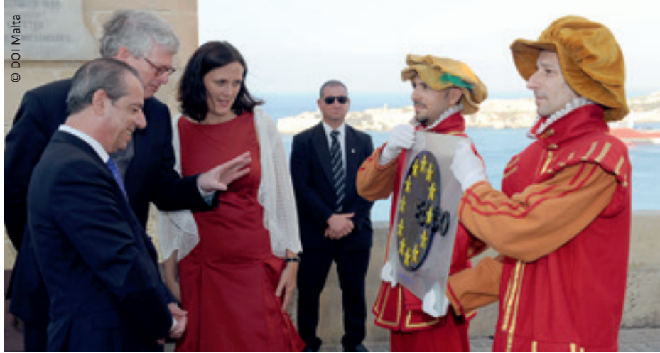
Onthulling van het logo van EASO, openingsceremonie op 19 juni 2011 in Valletta