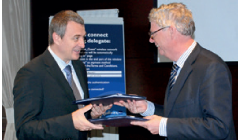
Ondertekening van het operationele plan met Bulgarije op 17 oktober 2013