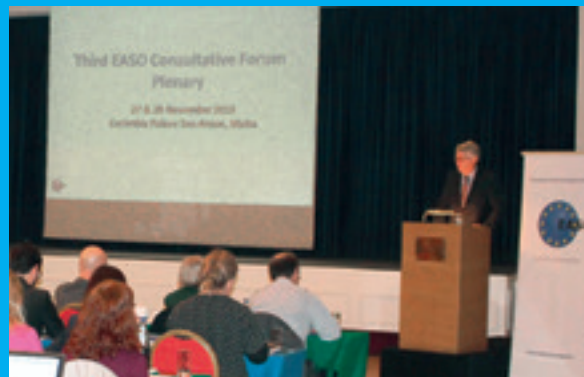
3. poradné fórum, Malta 27. a 28. novembra 2013

Poradné fórum úradu EASO je nepretržitý obojstranný dialóg, ktorý umožňuje výmenu informácií a zhromažďovanie poznatkov medzi úradom a občianskou spoločnosťou. Keďže je európskym odborným strediskom, nie sú tieto porady len výročným zasadnutím, ale nepretržitým obojstranným dialógom, ktorý spája expertov na rôzne aspekty azylu s cieľom vymieňať si poznatky a odborné znalosti. Tento proces poskytuje hlbšie pochopenie a informácie, ktoré pomáhajú úradu rozvíjať komplexnejšie a pokročilé nástroje praktickej spolupráce zamerané na podporu realizácie CEAS. Úrad sa obzvlášť zaujíma o informácie týkajúce sa obsahu. Medzi oblasti osobitného záujmu patrí včasné varovanie a pripravenosť, odborná príprava, procesy kvality, maloleté osoby bez sprievodu, hľadanie rodinných väzieb, pohlavie, zraniteľné skupiny, presídlenie, presun osôb a poskytnutie núdzovej podpory členskými štátom vystaveným mimoriadnemu tlaku.