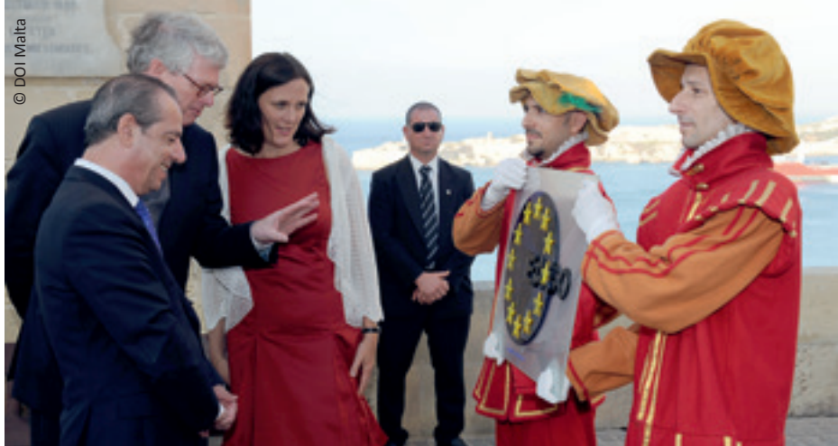
Odhalenie loga úradu EASO, slávnostné otvorenie, Valletta 19. júna 2011