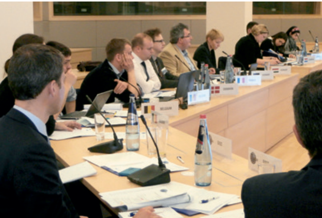
Odborná príprava úradu EASO