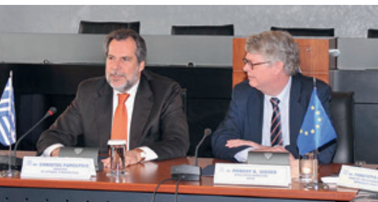
Podpísanie operačného plánu s Gréckom, Atény 1. apríla 2011

Na základe žiadosti gréckej vlády vo februári 2011 úrad EASO súhlasil s poskytnutím podpory Grécku v podobe vytvorenia novej azylovej služby, služby prvého príjmu, odvolacieho orgánu a prijímania vo všeobecnosti a zníženia počtu nevybavených prípadov vyslaním expertov z rôznych členských štátov EÚ v tzv. podporných azylových tímoch. V prvej fáze podpory Grécku, ktorá sa skončila v marci 2013, úrad vyslal a riadil 70 expertov zo 14 členských štátov. Títo experti vytvorili 52 podporných azylových tímov. Na žiadosť gréckej vlády o ďalšiu podporu zo začiatku roka 2013 bude úrad v podpore Grécka pokračovať do decembra 2014. V tejto druhej fáze úrad podporuje Grécko vyslaním podporných azylových tímov, ktoré poskytujú odbornú prípravu na určovanie štátnej príslušnosti (v úzkej spolupráci s Frontexom), a podporu týkajúcu sa financovania zo zdrojov EÚ, podporu pri zbere a analýze štatistických údajov a podporu v oblasti COI. V závislosti od požiadaviek gréckej vlády môže úrad reorganizovať alebo zintenzívniť svoje operácie.