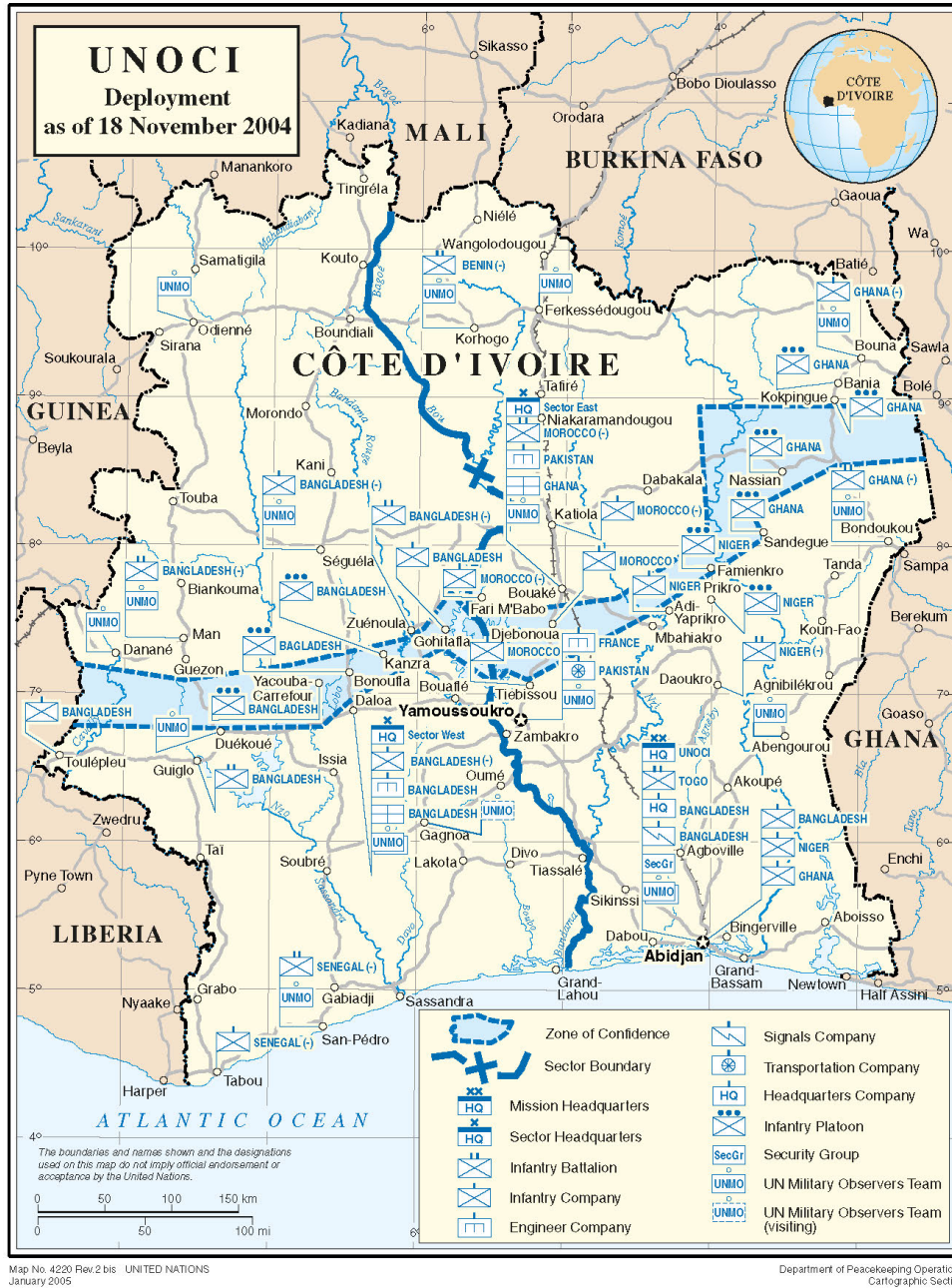
Mappa 3: UNOCI, Costa d'Avorio, 18 novembre 2004, © UN 112