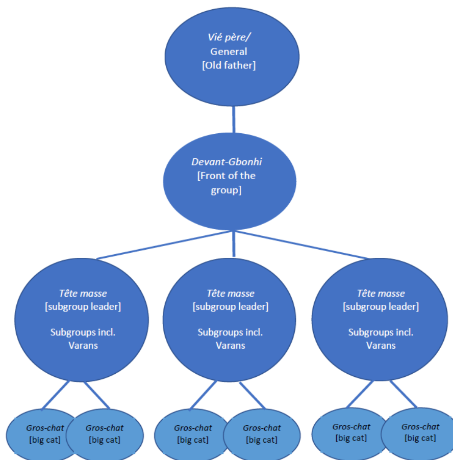
Figura 2: struttura di un gruppo di microbe

I microbe operano in gruppo, soprattutto di notte in quartieri che conoscono bene 473 , ad esempio ad Abobo, Anyama, Attécoubé, Adjamé, a volte anche a Yopougon o ai margini di Cocody. 474 In genere agiscono in questo modo: un gruppo numeroso entra in una strada affollata e crea scompiglio, simulando una rissa tra i suoi membri o con una gang rivale, quindi, muovendosi molto rapidamente, ruba tutto quello che riesce a chiunque si trovi sulla sua strada prima di battere in ritirata in modo organizzato. 475 Un'altra tattica consiste nel fermare i passanti fingendo di mendicare cibo o denaro, quindi circondarli velocemente e derubarli. 476 Le armi che utilizzano sono soprattutto machete, coltelli, bastoni o altri oggetti contundenti 477 , raramente armi da fuoco. 478 La loro è una violenza cieca,