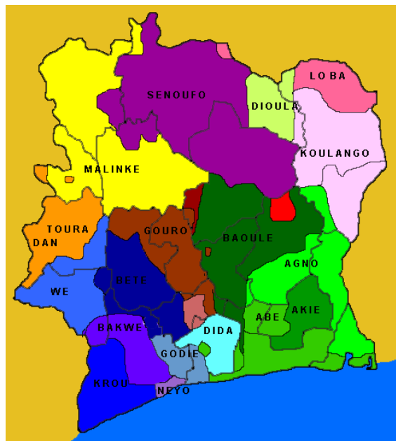
Mappa 2: i principali gruppi etnici della Costa d'Avorio 25

Dal punto di vista culturale, i gruppi sono essenzialmente cinque. 26