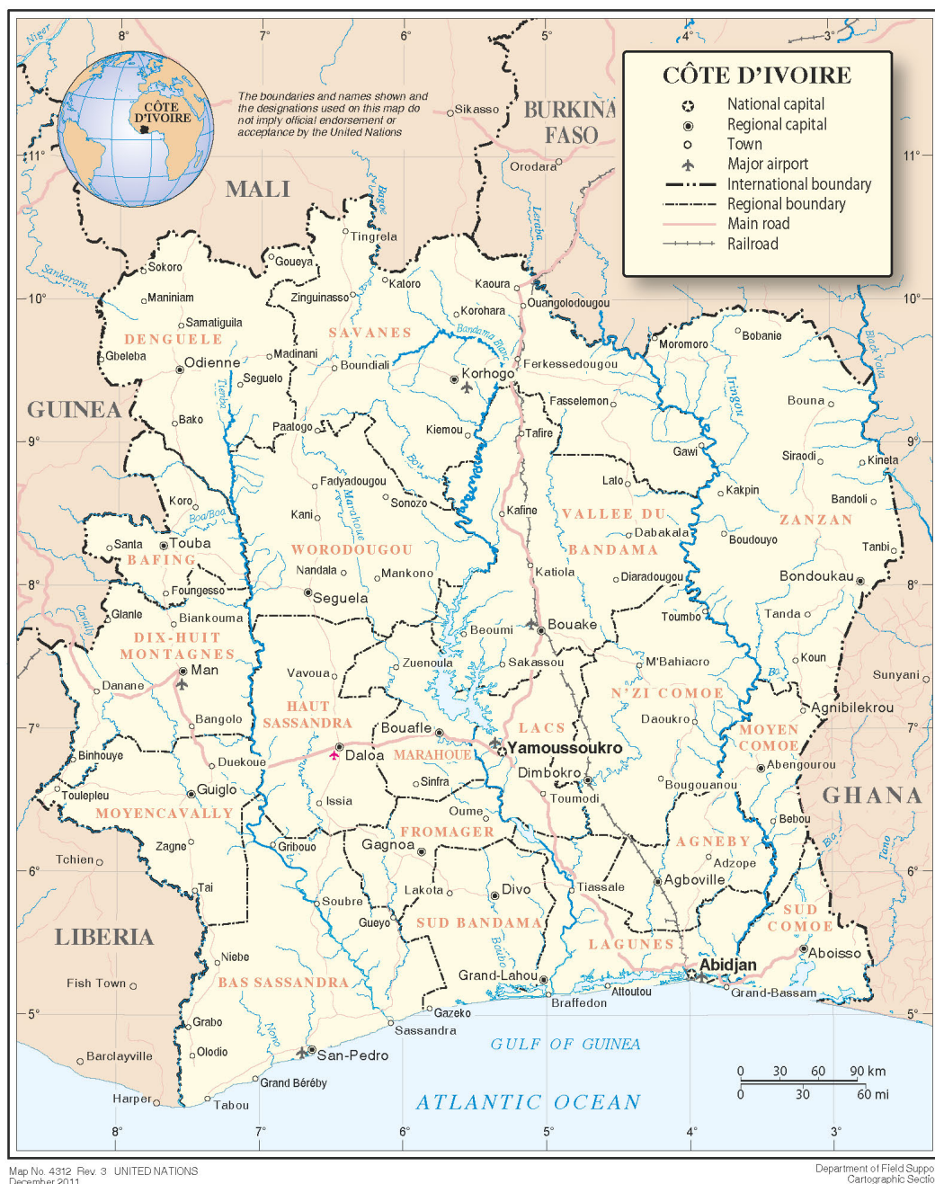
Carta 1: Costa d'Avorio, dicembre 2011, © Nazioni Unite 3