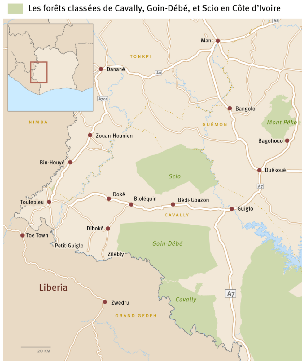
Carta 4: le foreste protette della Costa d'Avorio occidentale, © Human Rights Watch, giugno 2016 645

Nel 2013, il periodo di transizione previsto dalla legge fondiaria rurale prima che lo Stato possa esercitare il diritto di prelazione sui «terreni senza proprietari» è stato prorogato di 10 anni: 646 rimanevano da identificare quattro milioni di parcelle (corrispondenti ad altrettanti titoli di proprietà da rilasciare) e da delimitare 10 000 villaggi rurali su 11 000. 647