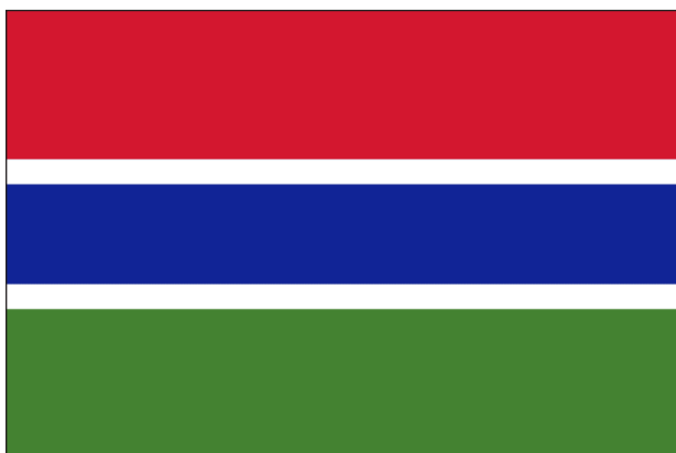
Immagine 1: bandiera del Gambia.

Le caratteristiche geografiche si riflettono nella bandiera nazionale: il rosso simboleggia il sole, il blu il fiume Gambia, il verde l’agricoltura, il bianco la pace e l’unità (10) .