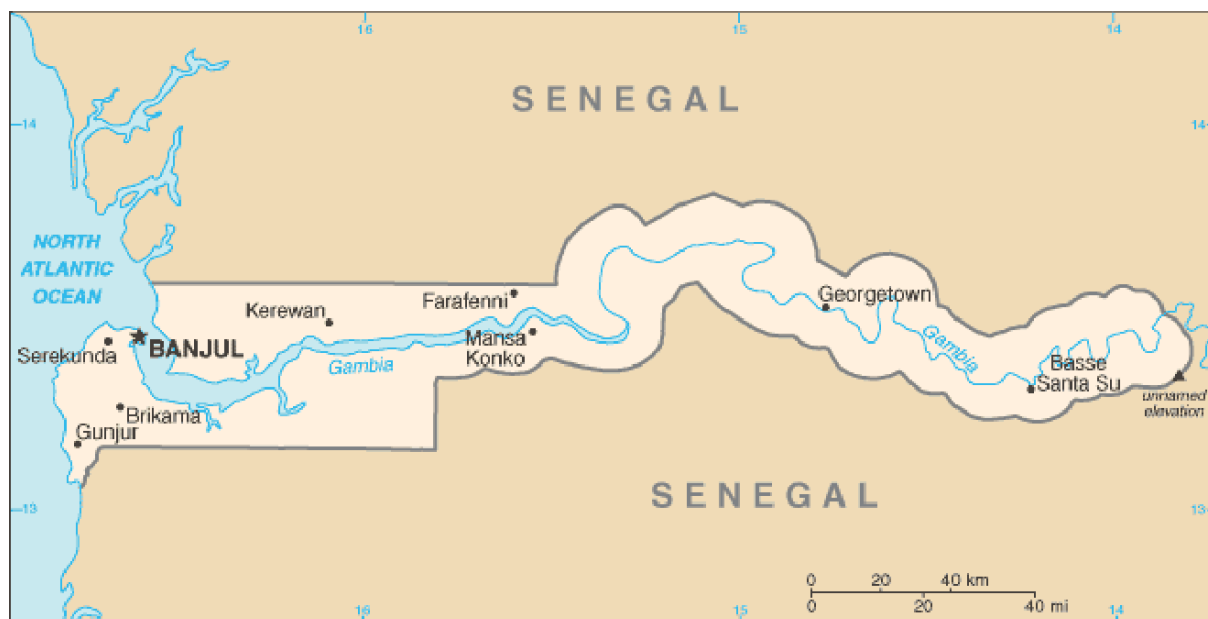
Carta 1: CIA (Central Intelligence Agency) (6) .