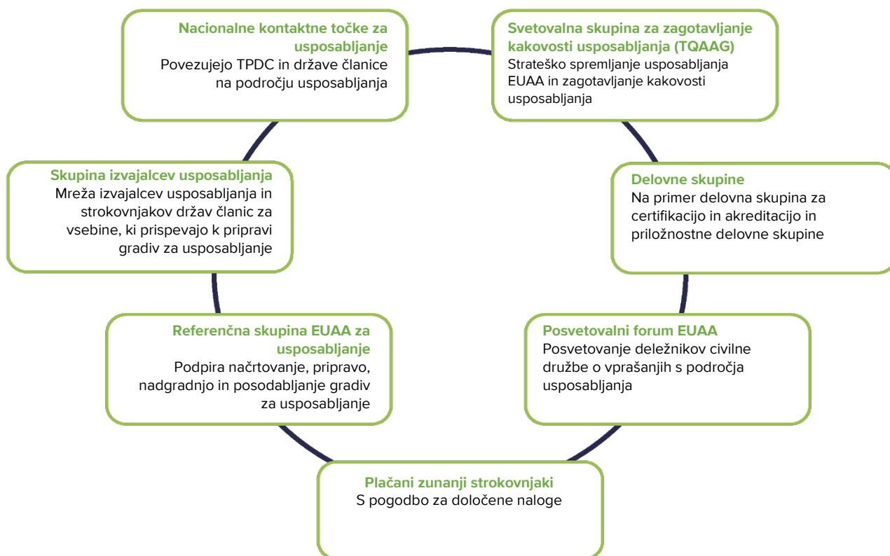
Slika 2: Svetovalna in delovna skupina