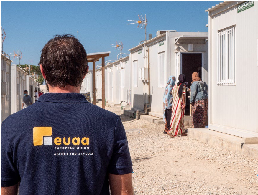
Foto: EUAA personal Pournara vastuvõtukeskuses Küprosel

Jätkame EL+ riikide toetamist ümberasustamise ja humanitaarsetel põhjustel vastuvõtmise valdkonnas.