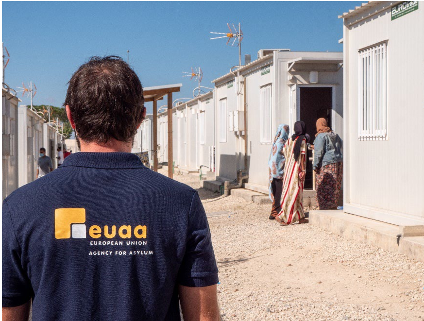
Fénykép: Az EUAA személyzete a ciprusi Pournara befogadó központban.

Az EU+ országok áttelepítésben és humanitárius befogadásban való támogatása folytatódni fog.