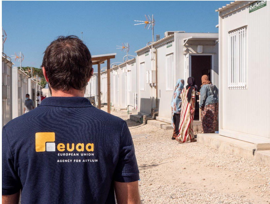
Zdjęcie: pracownicy EUAA w ośrodku recepcyjnym Pournara na Cyprze.

Będziemy nadal udzielać wsparcia państwom UE+ w zakresie przesiedleń i przyjmowania ze względów humanitarnych.