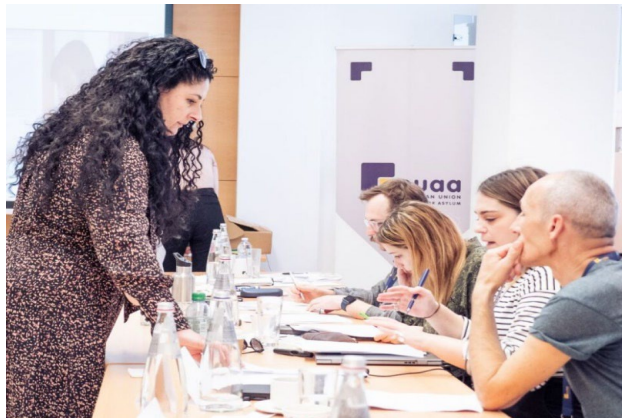
Fotografia: Odborná príprava školiteľov agentúry EUAA, Malta, 2023

V záujme lepšieho dosahu a posilnenia udržateľnosti intervencie v oblasti odbornej prípravy budeme pracovať na rozšírení skupiny kvalifikovaných školiteľov vo vnútroštátnych správnych orgánoch.