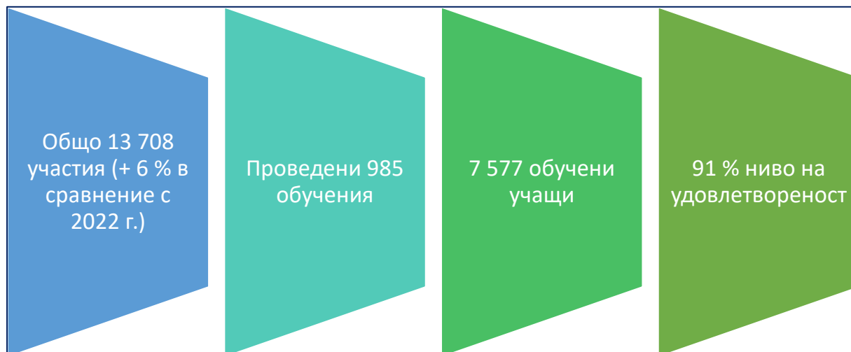
Фигура 2. Обучение на ЕУАА през 2023 г.

В областта на знанията в областта на убежището годишният доклад на ЕУАА в областта на убежището , публикуван през юли 2023 г., съдържа нови интерактивни функции в своята уеб версия, за улесняване на достъпа до информацията от базата данни с развитията на национално ниво в областта на убежището .