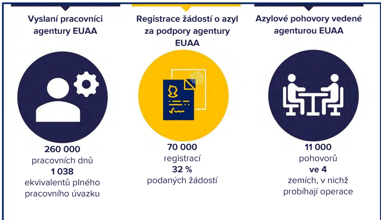
Obrázek 1. Operace agentury EUAA v roce 2023

Počet vyslaných zaměstnanců v absolutním vyjádření vzrostl nejvíce v Itálii a na Kypru, přičemž ve Španělsku, Belgii a Nizozemsku se jejich počet více než zdvojnásobil.