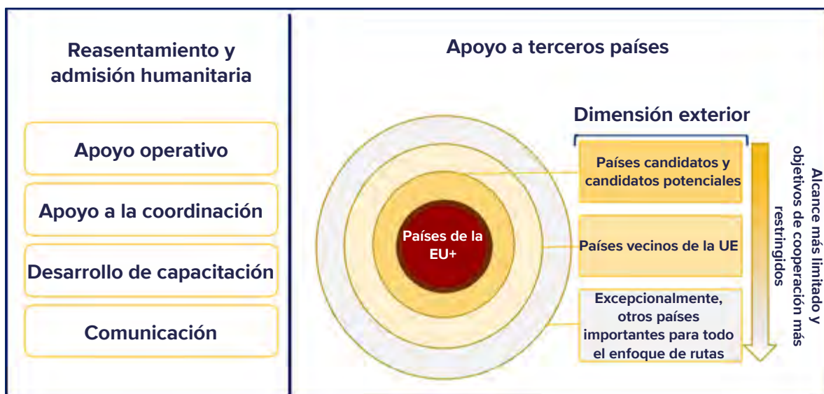
Gráfico 3. Pilares de la estrategia de cooperación exterior de la EUAA

La Agencia siguió apoyando las operaciones de reasentamiento de los países de la UE + a través de su Mecanismo de Apoyo al Reasentamiento en Turquía. Entre las 1 100 personas asistidas, los sirios fueron los más representados, seguidos de los afganos y los iraníes.