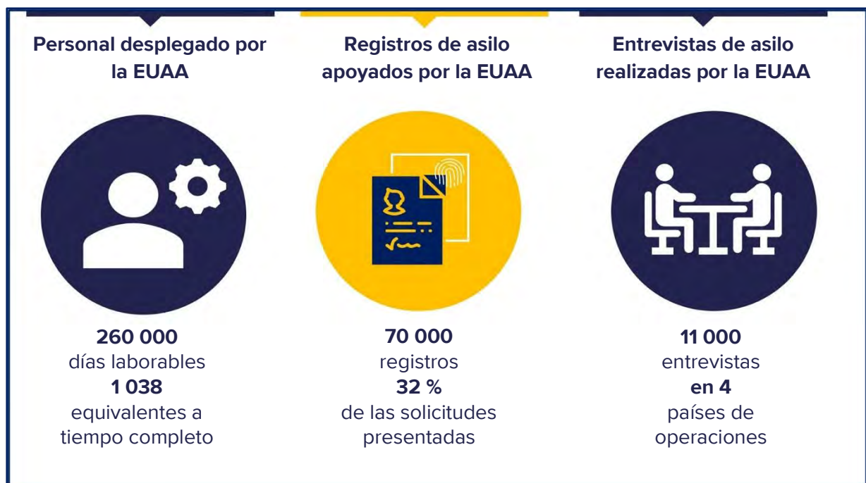
Gráfico 1. Operaciones de la EUAA en 2023

Italia y Chipre registraron el mayor aumento de personal en términos absolutos, mientras que los recursos se duplicaron con creces en España, Bélgica y los Países Bajos.