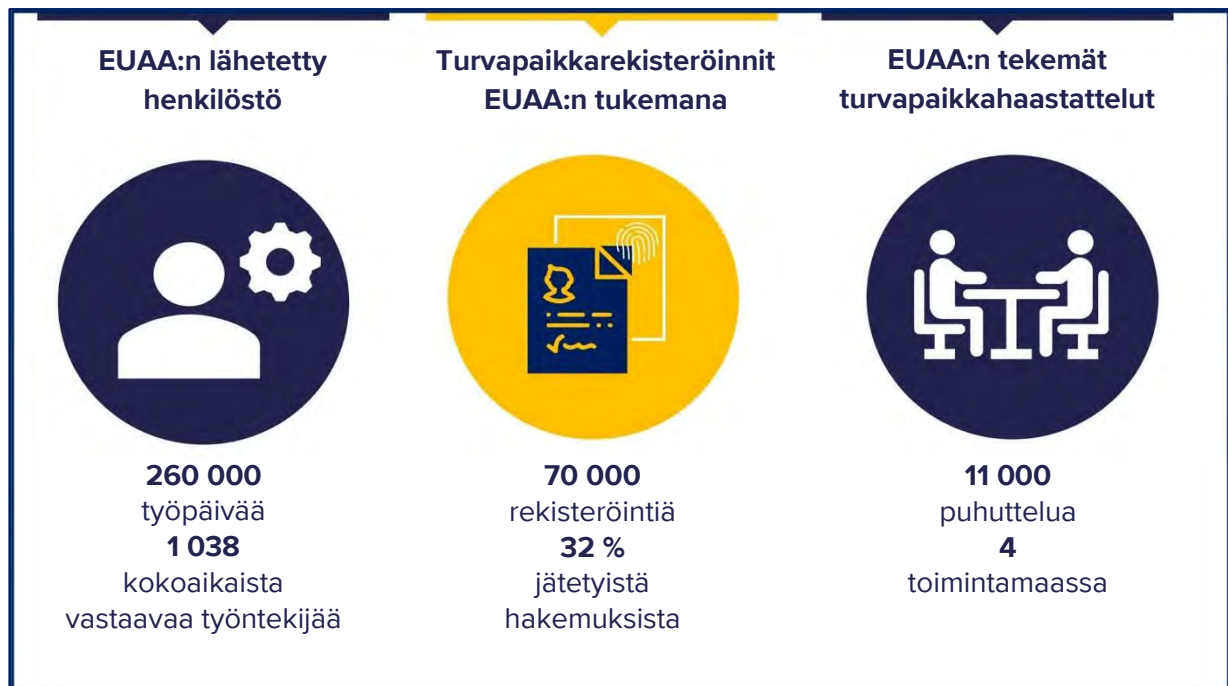
Kuvio 1. EUAA:n operaatiot vuonna 2023

Absoluuttisesti mitattuna henkilöstön määrä kasvoi eniten Italiassa ja Kyproksella. Espanjassa, Belgiassa ja Alankomaissa resurssit puolestaan yli kaksinkertaistuivat.