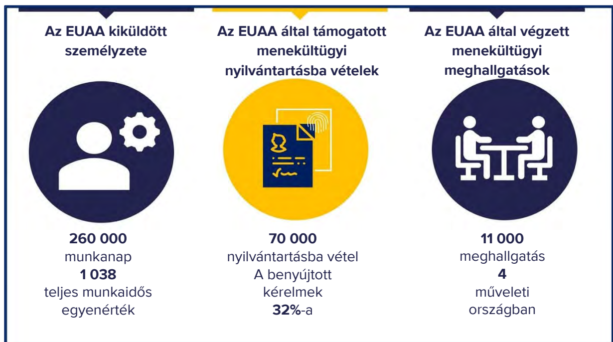
1. ábra Az EUAA műveletei 2023-ban

Olaszországban és Cipruson nőtt a legnagyobb mértékben a személyzet létszáma abszolút értékben, míg Spanyolországban, Belgiumban és Hollandiában több mint kétszeresére nőttek az erőforrások.