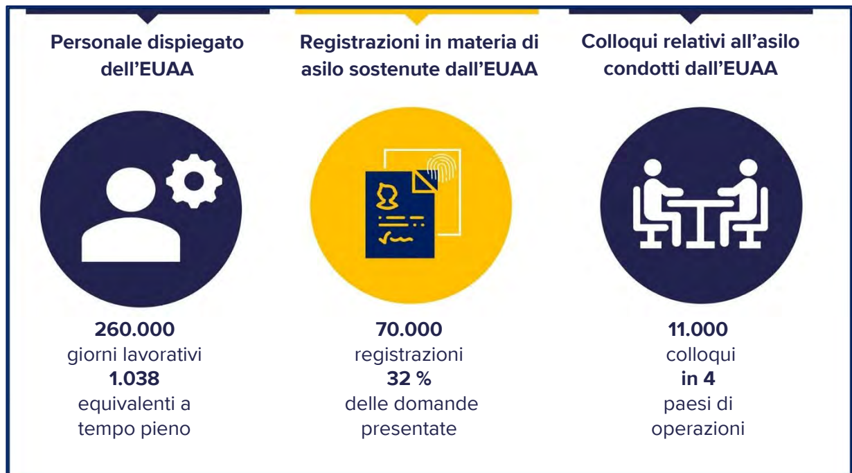
Figura 1. Operazioni dell'EUAA nel 2023

L'Italia e Cipro hanno registrato il maggiore aumento del personale in termini assoluti, mentre le risorse sono più che raddoppiate in Spagna, Belgio e nei Paesi Bassi.