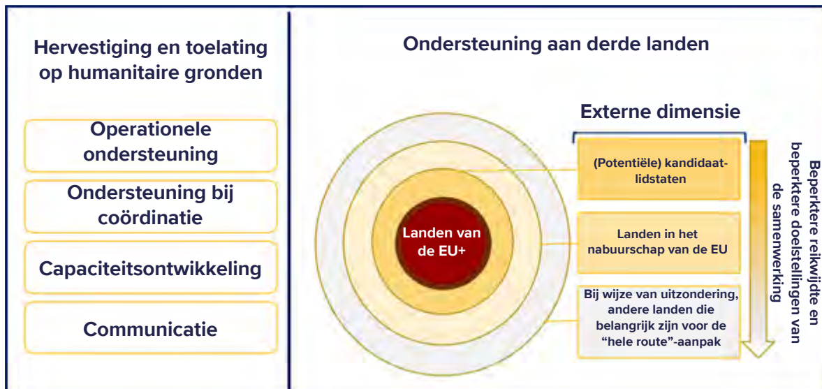
Figuur 3. Pijlers van de strategie voor externe samenwerking van het EUAA

Het Agentschap bleef de hervestigingsoperaties van de landen van de EU+ ondersteunen via zijn ondersteuningsfaciliteit voor hervestiging in Turkije. Onder de 1 100 personen die hulp kregen, waren Syriërs het meest vertegenwoordigd, gevolgd door Afghanen en Iraniërs.