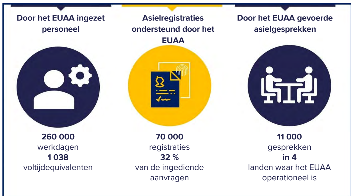
Figuur 1. Operationele EUAA-activiteiten in 2023

De grootste toename in personeel in absolute termen vond plaats in Italië en Cyprus, terwijl het aantal personele middelen meer dan verdubbelde in Spanje, België en Nederland.