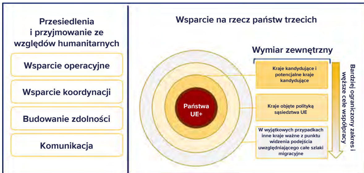
Rys. 3. Filary strategii współpracy zewnętrznej EUAA

Agencja nadal wspierała operacje przesiedleń w państwach UE+ za pośrednictwem swojego instrumentu wsparcia przesiedleń w Turcji. Spośród 1100 osób, którym udzielono pomocy, największą grupę stanowili Syryjczycy, a następnie Afgańczycy i Irańczycy.