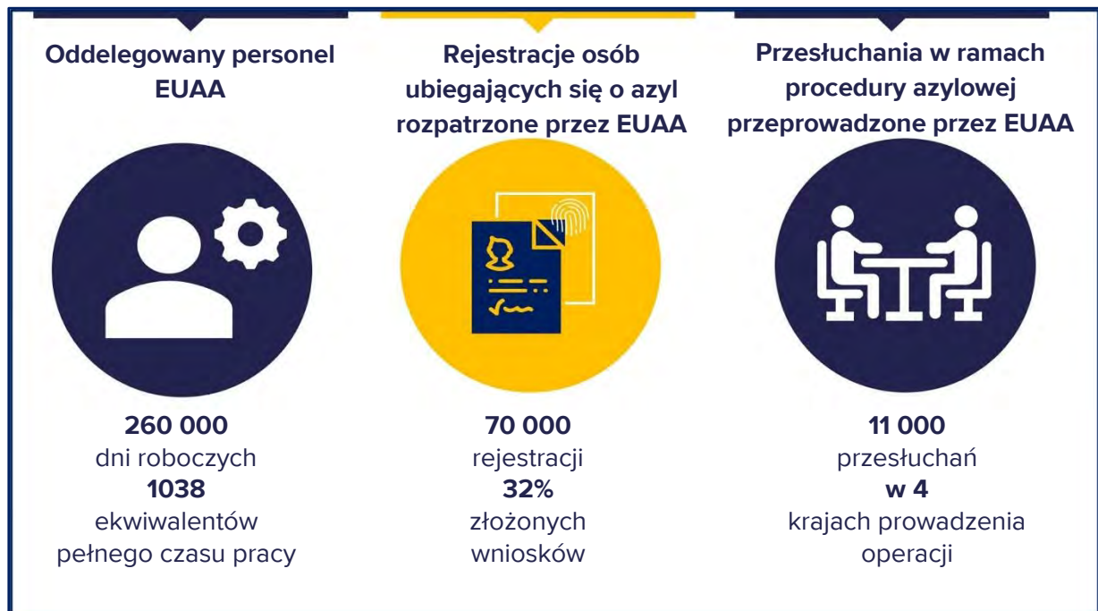
Rys. 1. Operacje EUAA w 2023 r.

Największy wzrost liczby personelu w ujęciu bezwzględny odnotowano we Włoszech i na Cyprze, natomiast w Hiszpanii, Belgii i Niderlandach zasoby wzrosły ponad dwukrotnie.