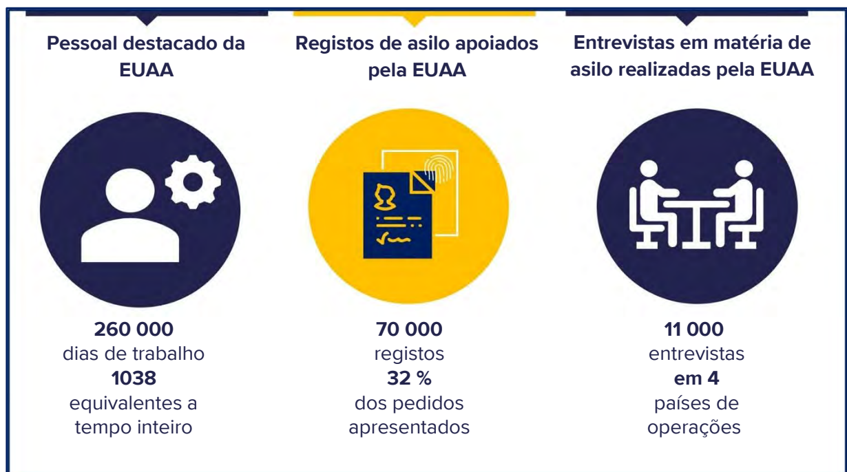
Figura 1. Operações da EUAA em 2023

A Itália e o Chipre registaram o maior aumento de pessoal em termos absolutos, enquanto os recursos mais do que duplicaram em Espanha, na Bélgica e nos Países Baixos.