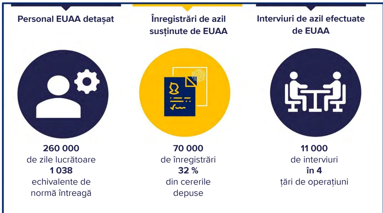
Figura 1. Operațiuni EUAA în 2023

Italia și Ciprul au înregistrat cea mai mare creștere a personalului în termeni absoluți, în timp ce resursele au crescut de peste două ori în Spania, Belgia și Țările de Jos.