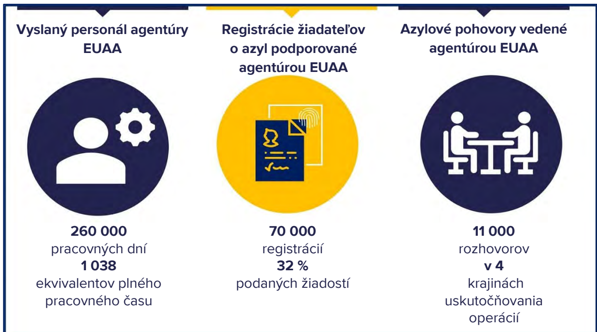
Obrázok 1 Operácie agentúry EUAA v roku 2023

Taliansko a Cyprus zaznamenali najvyšší nárast počtu zamestnancov v absolútnom vyjadrení, zatiaľ čo zdroje sa viac ako zdvojnásobili v Španielsku, Belgicku a Holandsku.