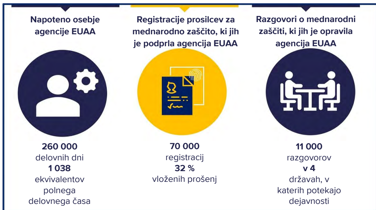
Slika 1: Dejavnosti agencije EUAA v letu 2023

V absolutnem smislu se je število zaposlenih najbolj povečalo v Italiji in na Cipru, v Španiji, Belgiji in na Nizozemskem pa so se viri več kot podvojili.