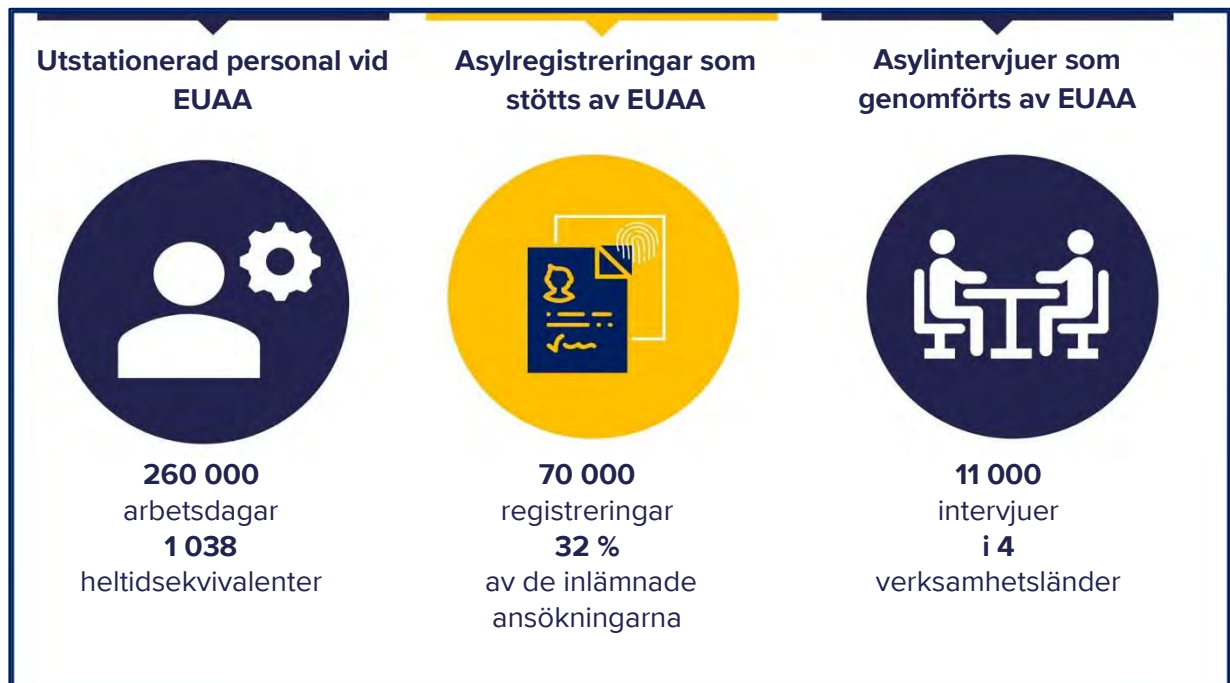
Figur 1. EUAA:s insatser under 2023

Italien och Cypern hade den största personalökningen i absoluta tal, medan resurserna mer än fördubblades i Spanien, Belgien och Nederländerna.