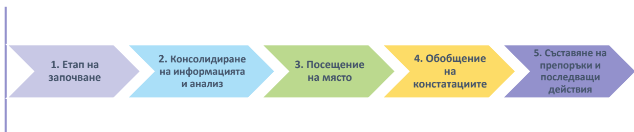
Фигура 1. Етапи на мониторинг

За да се даде възможност за ефективно планиране и организиране, всеки мониторинг е структуриран в пет основни етапа, описани по-долу. За тематични и ad hoc дейности за мониторинг може да се наложат корекции в съответствие с принципа на пропорционалност.