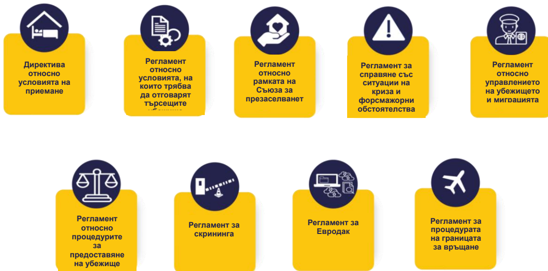
Фигура 1. Законодателните инструменти на пакта влязоха в сила през юни 2024 г.

последните текстове, които са част от Пакта за миграцията и убежището (Пакта) през 2024 г., нашите задачи се развиха допълнително. Пактът е набор от нови правила за управление на миграцията и реформиране на ОЕСУ. Нейните законодателни инструменти изискват промени или иновации, за които е необходим активният принос от ЕУАА. Ето защо нашите усилия през следващите години са съсредоточени върху предоставянето на услугите и инструментите, предвидени в Пакта, и върху осигуряването на възможност за ефективното му прилагане от държавите членки.