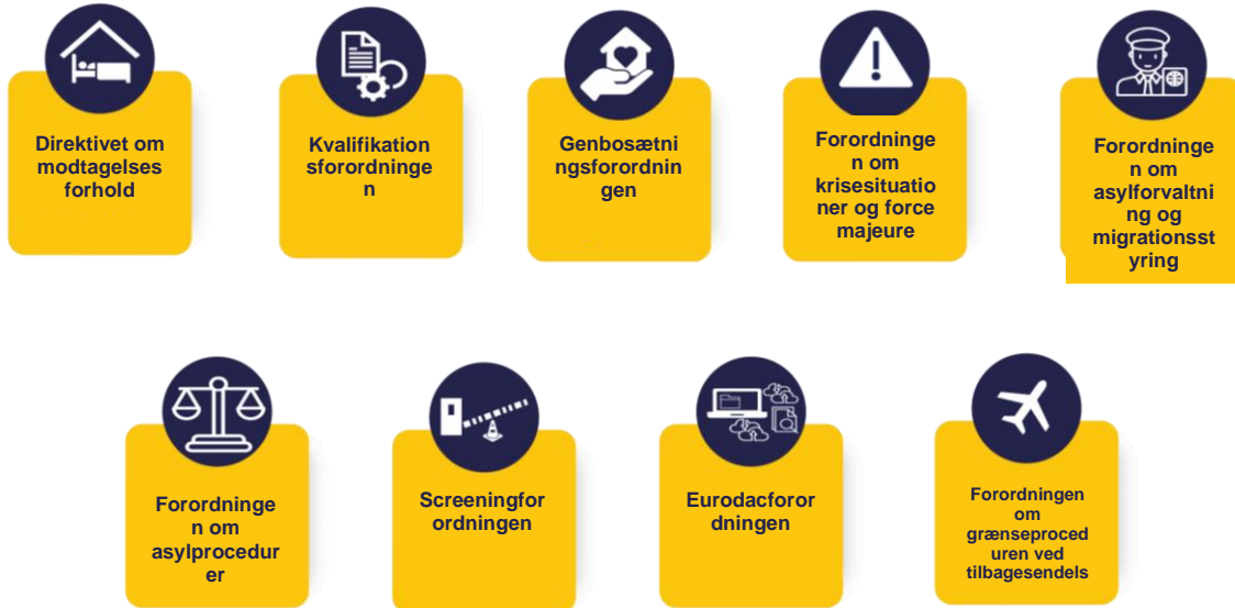
Figur 1. Lovgivningsinstrumenterne i pagten trådte i kraft i juni 2024.

EUAA. Vores indsats i de kommende år er derfor fokuseret på at levere de tjenester og værktøjer, der er omhandlet i pagten, og muliggøre effektiv gennemførelse i medlemsstaterne.