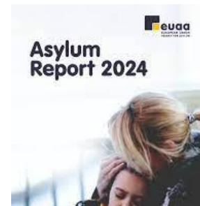
Figur 3: EUAA's asylrapport for 2024

Vi vil fortsat levere kvalitative og kvantitative analyser om asyl og modtagelse, rapporter om tidlig varsling og situationsbevidsthed i realtid samt prognoser om asylsituationen for at støtte beslutningstagningen i medlemsstaterne. Adgangen til vores analytiske portefølje vil blive yderligere forbedret gennem internetportaler og databaser. Den årlige asylrapport , som fra 2025 vil være i et meget mere strømlinet og analytisk format end de foregående år, giver en omfattende og kvalitativ analyse af asylsituationen i EU.