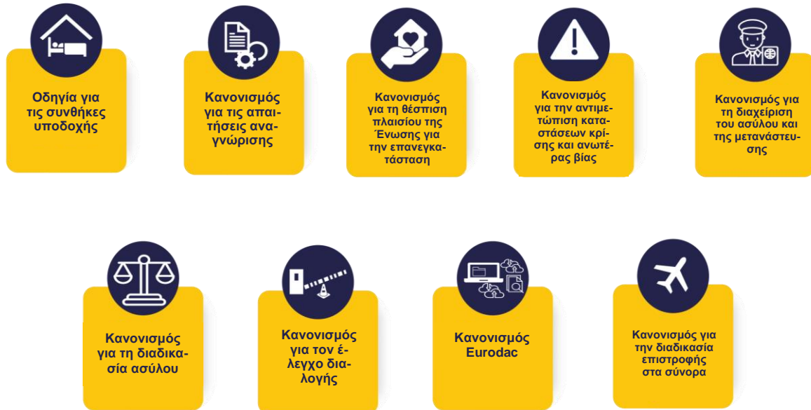
Εικόνα 1. Τα νομοθετικά εργαλεία του Συμφώνου τέθηκαν σε ισχύ τον Ιούνιο του 2024.

τελευταίων κειμένων που αποτελούν μέρος του Συμφώνου για τη Μετανάστευση και το Άσυλο (στο εξής «το Σύμφωνο») το 2024, οι αρμοδιότητες μας διευρύνθηκαν περαιτέρω. Το Σύμφωνο είναι ένα σύνολο νέων κανόνων για τη διαχείριση της μετανάστευσης και τη μεταρρύθμιση του ΚΕΣΑ. Τα νομοθετικά του εργαλεία προβλέπουν αλλαγές ή καινοτομίες, οι οποίες απαιτούν την ενεργό συμβολή του ΕΥΑΑ. Ως εκ τούτου, οι προσπάθειές μας κατά τα επόμενα έτη επικεντρώνονται στην παροχή υπηρεσιών και εργαλείων, όπως προβλέπονται στο Σύμφωνο, και στην εξασφάλιση της αποτελεσματικής εφαρμογής του Συμφώνου από τα κράτη μέλη.