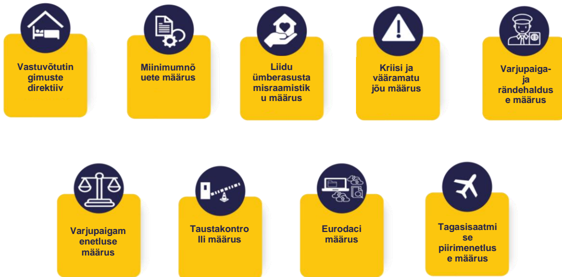
Joonis 1. Leppe õigusaktid jõustusid juunis 2024.

ettenähtud teenuste ja vahendite pakkumisele ning sellele, kuidas liikmesriigid saaksid lepet tõhusalt rakendada.