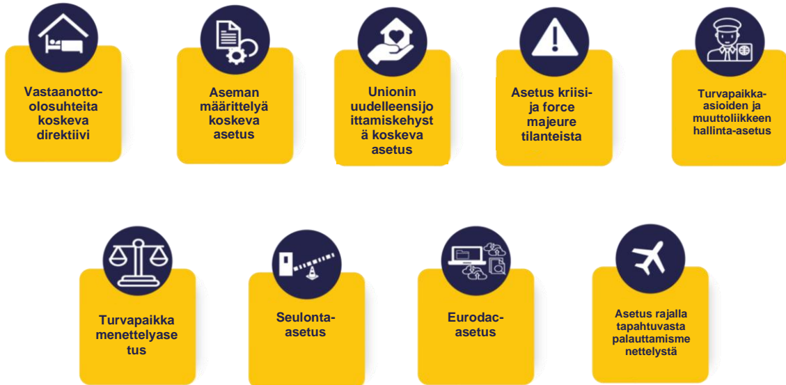
Kaavio 1. Sopimuksen lainsäädäntövälineet tulivat voimaan kesäkuussa 2024.

ja Euroopan yhteisen turvapaikkajärjestelmän uudistamiseen. Sen lainsäädäntövälineet edellyttävät muutoksia tai uudistuksia, joiden toteuttamiseen tarvitaan EUAA:n aktiivista osallistumista. Näin ollen EUAA keskittyy tulevana vuosina sopimuksessa tarkoitettujen palvelujen ja välineiden tarjoamiseen ja sopimuksen tehokkaaseen täytäntöönpanoon jäsenvaltioissa.