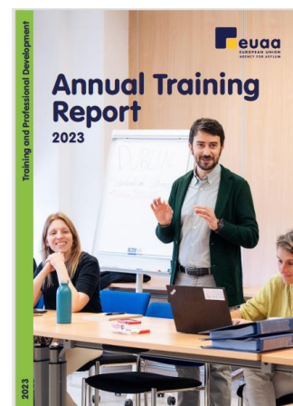
Slika 4. EUAA-ovo godišnje izvješće o osposobljavanju za 2023.