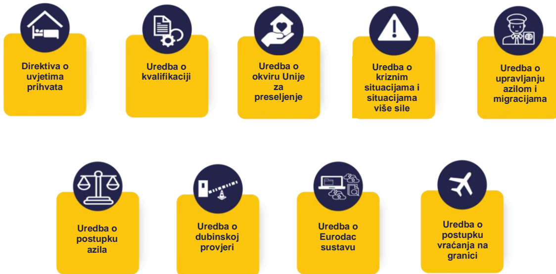
Slika 1. Zakonodavni instrumenti pakta stupili su na snagu u lipnju 2024.

alata predviđenih u paktu i omogućavanje njegove učinkovite provedbe u državama članicama.