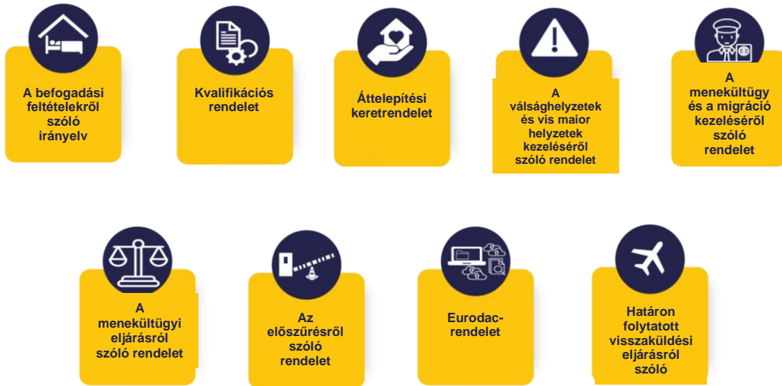
1. ábra A paktum jogalkotási eszközei 2024 júniusában léptek hatályba.

feladataink köre kiszélesedett. A paktum a migráció kezelésére és a KEMR reformjára vonatkozó új szabályok összességét tartalmazza. Jogalkotási eszközei olyan változtatásokra vagy újításokra szólnak fel, amelyekhez az EUAA aktív közreműködésére van szükség. Az elkövetkező években erőfeszítéseink tehát a paktumban előírányzott szolgáltatások és eszközök nyújtására, valamint a paktum tagállamok általi hatékony végrehajtásának lehetővé tételére összpontosulnak.