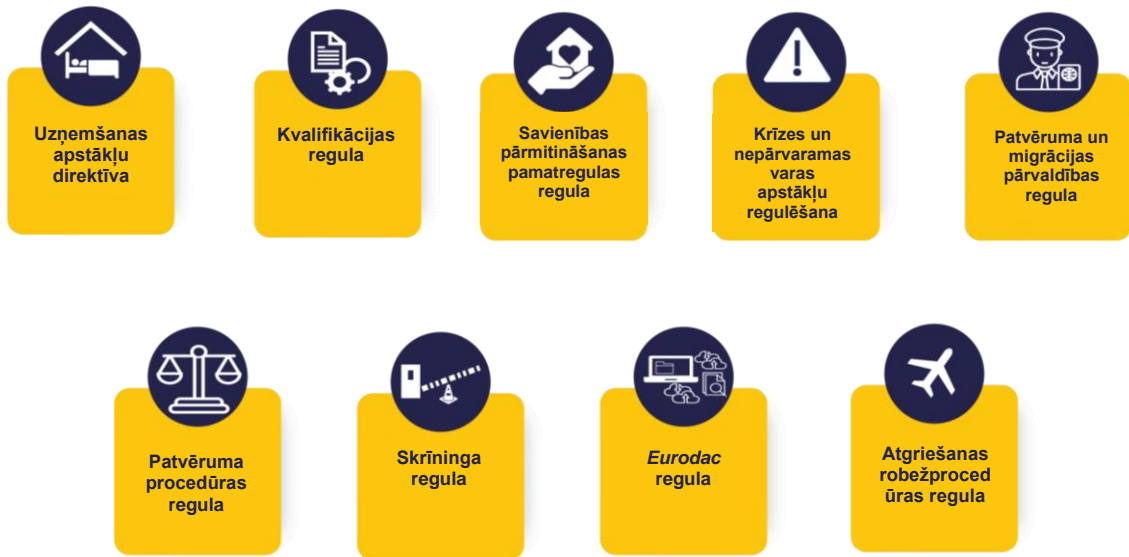
1. attēls. Pakta likumdošanas instrumenti stājās spēkā 2024. gada jūnijā.

EUAA palīdzība. Tādējādi mūsu centieni turpmākajos gados ir vērsti uz to, lai sniegtu Paktā paredzētos pakalpojumus un instrumentus un ļautu dalībvalstīm to efektīvi īstenot.