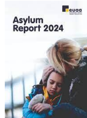
3. attēls. EUAA 2024. gada ziņojums par situāciju patvēruma jomā

Mūsu priekšā ir svarīgs uzdevums – saskaņot Eiropas patvēruma mācību programmas dažādus modeļus ar Pakta tiesību aktiem un nodrošināt atjauninātu apmācību praktiķiem. Tāpēc mēs strādāsim pie atjauninātās Eiropas patvēruma mācību programmas izstrādes, pilnveidošanas un īstenošanas, ieviešot pakāpenisku pieeju, kurā par prioritāti izvirzītas