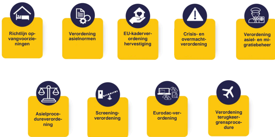
Figuur 1: De wetgevingsinstrumenten van het pact zijn in juni 2024 in werking getreden.

Sinds 2022 is ons mandaat herzien en versterkt om de vooruitzichten op een gemeenschappelijk asielbeleid in Europa te verbeteren. Met de goedkeuring van de laatste teksten die deel uitmaken van het migratie- en asielpact (“het pact”) in 2024, zijn onze taken verder geëvolueerd. Het pact omvat een reeks nieuwe regels voor het migratiebeheer en de hervorming van het gemeenschappelijk Europees asielstelsel. De wetgevingsinstrumenten van het pact vragen om veranderingen of innovaties die actieve inbreng van het EUAA vereisen. Onze inspanningen in de komende jaren zijn dan ook gericht op het verlenen van de in het pact voorziene diensten en instrumenten en op het mogelijk maken van de doeltreffende tenuitvoerlegging ervan door de lidstaten.