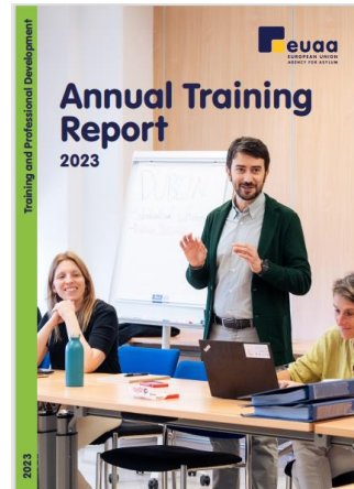
Rysunek 4: Roczne sprawozdanie ze szkoleń EUAA za 2023 r.

W dalszym ciągu będziemy identyfikować potrzeby szkoleniowe i wdrażać działania szkoleniowe, również w ramach planów operacyjnych podpisywanych z państwami członkowskimi poddawanymi nieproporcjonalnej presji. Będziemy pracować nad zacieśnieniem współpracy i wymiany z państwami członkowskimi w zakresie szkoleń i rozwoju zawodowego. Będziemy również nadal szkolić urzędników i budować zdolności poza Europą. Wsparcie szkoleniowe w partnerskich krajach trzecich jest zgodne z naszą zaktualizowaną strategią współpracy zewnętrznej . Nasz roczny raport szkoleniowy będzie ponownie zawierał wyczerpujące aktualne informacje o wynikach osiągniętych każdego roku, także z 2025 r. i kolejnych lat.