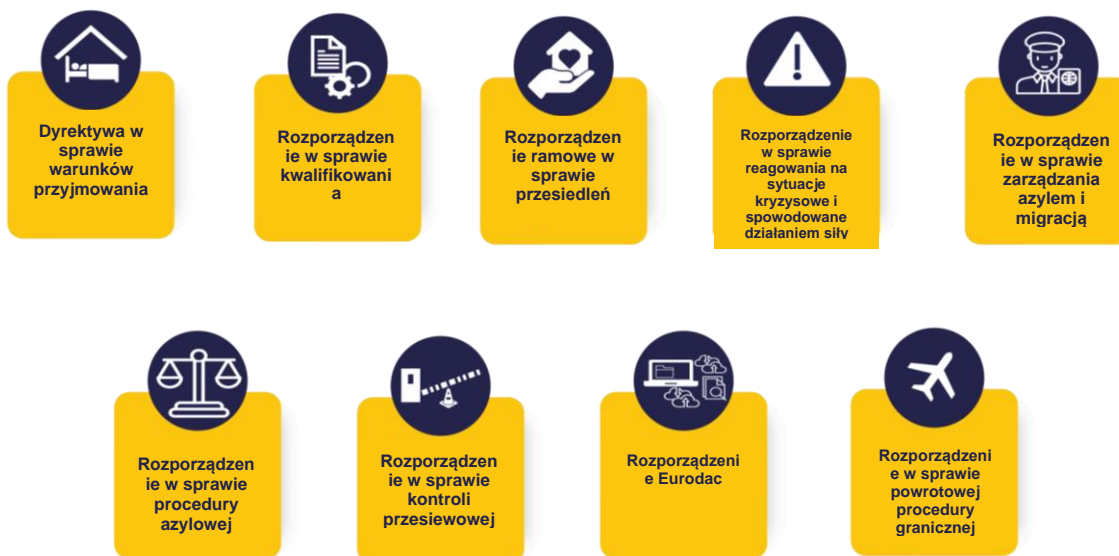
Wykres 1. Instrumenty prawne paktu weszły w życie w czerwcu 2024 r.

europejskiego systemu azylowego. Jego instrumenty prawne przewidują zmiany lub innowacje, które wymagają aktywnego udziału EUAA. Nasze wysiłki w nadchodzących latach koncentrują się zatem na świadczeniu usług i dostarczaniu narzędzi przewidzianych w pakcie oraz umożliwieniu jego skutecznego wdrożenia przez państwa członkowskie.