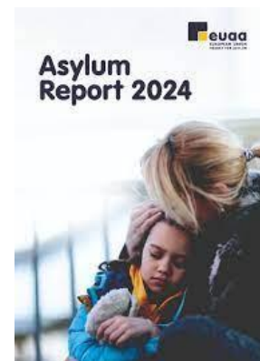
Rysunek 3: Sprawozdanie EUAA dotyczące azylu za 2024 r.

Począwszy od 2025 r. wdrożymy za pomocą dwóch ćwiczeń pilotażowych mechanizm monitorowania EUAA. Mechanizm ten będzie nadzorował operacyjne i techniczne stosowanie wspólnego europejskiego systemu azylowego w państwach członkowskich co najmniej raz na pięć lat. Ponadto w tym okresie przeprowadzimy co najmniej jedno tematyczne ćwiczenie w zakresie monitorowania skupiające się na konkretnych lub tematycznych aspektach WESA we wszystkich państwach członkowskich. Mechanizm ten służy rozwiązaniu obecnych i przyszłych problemów i ma na celu poprawę ogólnego funkcjonowania systemów azylowych i systemów przyjmowania.