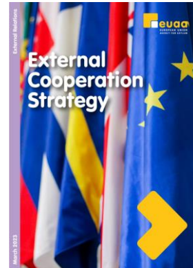
Rysunek 5: Strategia współpracy zewnętrznej EUAA na 2023 r.

Zgodnie ze strategią współpracy zewnętrznej dodatkowymi priorytetami są rozwój zdolności państw trzecich i wzmocniony, dwustronny dialog ze społeczeństwem obywatelskim.