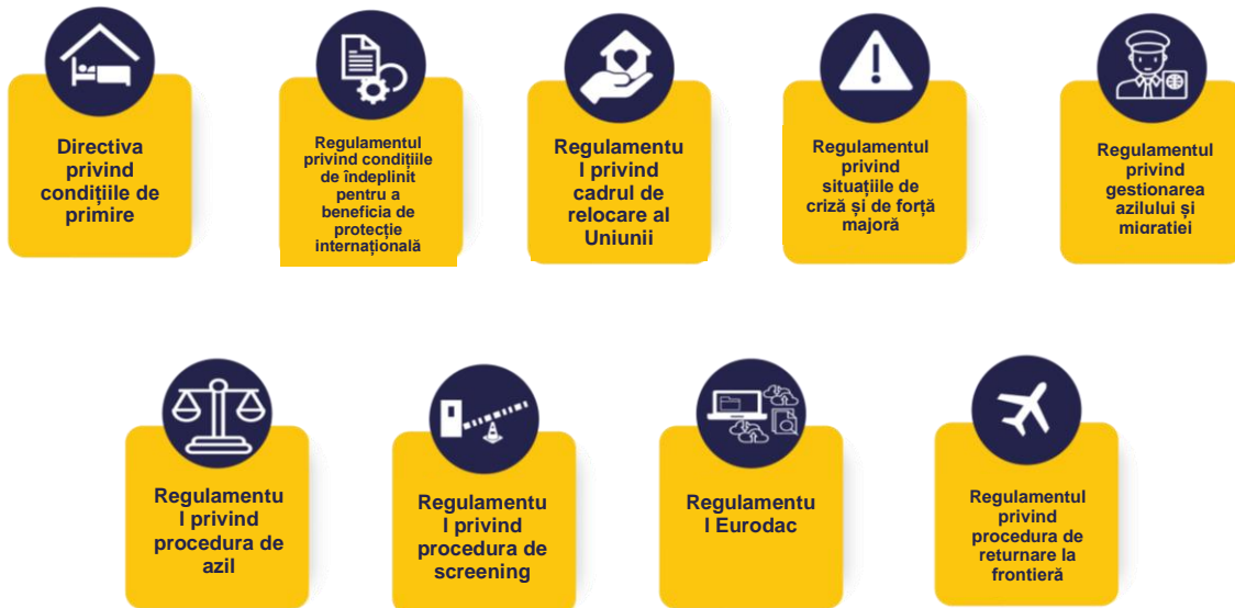
Figura 1. Instrumentele legislative ale pactului au intrat în vigoare în iunie 2024.

serviciilor și a instrumentelor prevăzute în pact și pe facilitarea aplicării lui eficace de către statele membre.