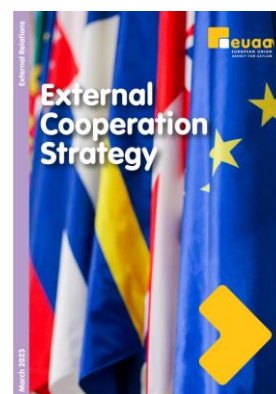
Obrázok č. 5: Stratégia v oblasti vonkajšej spolupráce EUAA na rok

V súlade so stratégiou vonkajšej spolupráce sú ďalšími prioritami rozvoj kapacít tretích krajín a posilnený obojstranný dialóg s občianskou spoločnosťou.