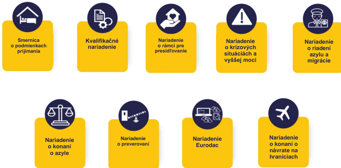
Obrázok č. 1: Legislatívne nástroje paktu nadobudli účinnosť v júni 2024.

v nasledujúcich rokoch je preto zamerané na poskytovanie služieb a nástrojov ustanovených v pakte a na jeho účinné vykonávanie členskými štátmi.