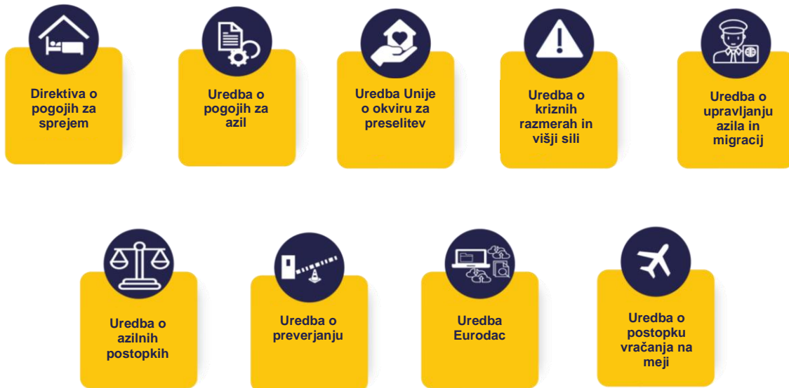
Slika 1: Zakonodajni instrumenti pakta so začeli veljati junija 2024.

na zagotavljanje storitev in orodij, predvidenih v paktu, in omogočanje njegovega učinkovitega izvajanja v državah članicah.