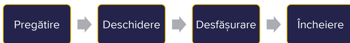
Figura 2. Etapele interviului personal

Această secțiune se axează pe desfășurarea unui interviu personal (a se vedea figura 2), deoarece acesta este piatra de temelie a procedurii de azil și tipul de interviu în care este cel mai probabil să furnizați traducere orală. De reținut că multe aspecte sunt relevante și pentru alte tipuri de interviuri.