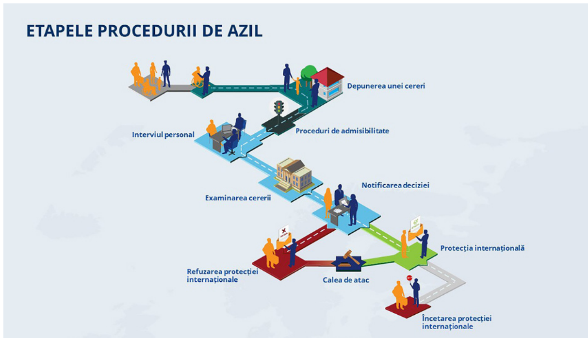
Figura 1. Etapele procedurii de azil