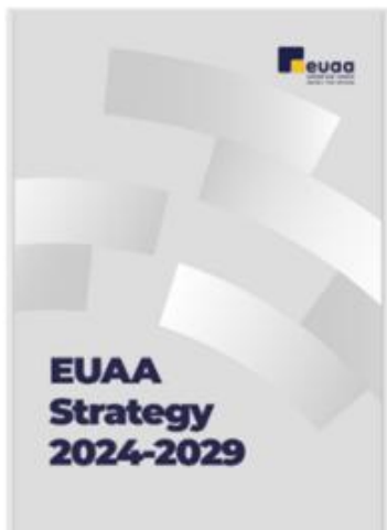
Фигура 2: Стратегия на ЕУАА за периода 2024–2029 г.

ЕПД е приведен в съответствие с приоритетите на политиката на Европейската комисия в областта на миграцията и убежището за периода 2024–2029 г., като се гарантира съгласуваност с по-широките цели на ЕС. Въз основа на Стратегията на ЕУАА за периода 2024–2029 г. многогодишната работна програма определя целите на Агенцията в четири основни области на дейност: оперативна подкрепа, обучение и професионално развитие, експертни познания в областта на убежището и хоризонтални дейности. В него се определят седем стратегически цели за периода 2026–2028 г.