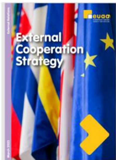
Фигура 6: Стратегия за външно сътрудничество на ЕУАА

допринася за прозрачността чрез годишния доклад на Агенцията относно убежището.