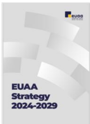
Figur 2: EUAA's strategi for 2024-2029

Enhedsprogrammeringsdokumentet er i overensstemmelse med Europa-Kommissionens politiske prioriteter for 2024-2029 på migrations- og asylområdet og sikrer sammenhæng med EU's bredere målsætninger. Med udgangspunkt i EUAA's strategi for 2024-2029 fastlægger det flerårige arbejdsprogram agenturets mål inden for fire hovedaktivitetsområder: operationel støtte, uddannelse og faglig udvikling, oplysninger om asyl samt tværgående aktiviteter. Det opstiller syv strategiske mål for perioden 2026-2028.