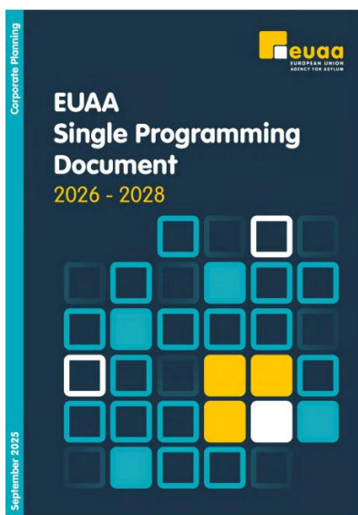
Figur 1: Enhedsprogrammeringsdokument for 2026-2028

Enhedsprogrammeringsdokumentet (SPD) er Den Europæiske Unions Asylagenturs (EUAA) overordnede programmeringsinstrument og fungerer som finansieringsafgørelse for agenturets operationelle aktiviteter. Dokumentet fastlægger agenturets flerårige og årlige planlægning af aktiviteter og ressourcer og sikrer sammenhæng mellem de strategiske mål, de operationelle aktiviteter og ressourcefordelingen.