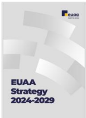
Εικόνα 2: Στρατηγική του ΕΥΑΑ για την περίοδο 2024-2029

Το ΕΕΠ ευθυγραμμίζεται με τις προτεραιότητες πολιτικής της Ευρωπαϊκής Επιτροπής για την περίοδο 2024-2029 στον τομέα της μετανάστευσης και του ασύλου, διασφαλίζοντας τη συνοχή με τους ευρύτερους στόχους της ΕΕ. Βάσει της στρατηγικής του ΕΥΑΑ για την περίοδο 2024-2029, το πολυετές πρόγραμμα εργασίας καθορίζει τους στόχους του Οργανισμού σε τέσσερις κύριους τομείς δραστηριότητας: επιχειρησιακή στήριξη, κατάρτιση και επαγγελματική εξέλιξη, γνώση σε θέματα ασύλου, και οριζόντιες δραστηριότητες. Θεσπίζει επτά στρατηγικούς στόχους για την περίοδο 2026-2028.