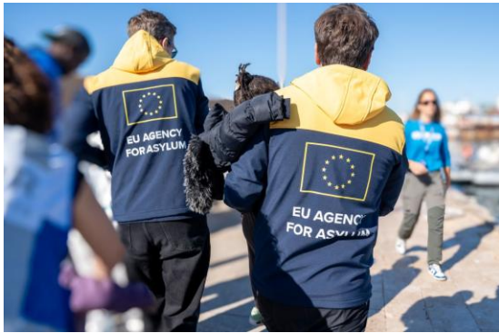
Εικόνα 3: Επιχειρησιακή υποστήριξη του ΕΥΑΑ στη Λαμπεντούζα

Με την έγκριση των νομοθετικών προτάσεων στο πλαίσιο του συμφώνου, ο Οργανισμός αναμένεται να διατηρήσει σημαντική επιχειρησιακή παρουσία, επεκτείνοντας παράλληλα το εύρος των αρμοδιοτήτων του εντός των ορίων των διαθέσιμων πόρων.