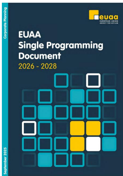
Εικόνα 1: ΕΕΠ 2026-2028

Το Ενιαίο Έγγραφο Προγραμματισμού (ΕΕΠ) αποτελεί το εργαλείο εταιρικού προγραμματισμού του Οργανισμού της Ευρωπαϊκής Ένωσης για το Άσυλο (ΕΥΑΑ) και επέχει θέση απόφασης χρηματοδότησης για τις επιχειρησιακές δραστηριότητες του Οργανισμού. Καθορίζει τον πολυετή και ετήσιο προγραμματισμό των δραστηριοτήτων και των πόρων του Οργανισμού, διασφαλίζοντας τη συνοχή μεταξύ των στρατηγικών στόχων, των επιχειρησιακών δραστηριοτήτων και της κατανομής των πόρων.