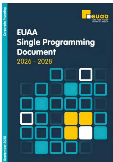
Figura 1. DOCUP 2026-2028

El documento único de programación (DOCUP) es el instrumento de programación institucional de la Agencia de Asilo de la Unión Europea (EUAA) y sirve como decisión de financiación para las actividades operativas de la Agencia. Establece la planificación plurianual y anual de las actividades y los recursos de la Agencia, garantizando la coherencia entre los objetivos estratégicos, las actividades operativas y la asignación de recursos.