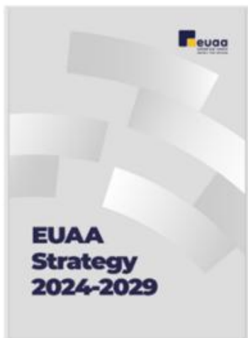
Figure 2: Stratégie de l'EUAA pour 2024-2029

Le DOCUP est aligné sur les priorités stratégiques de la Commission européenne pour 2024-2029 dans le domaine de la migration et de l'asile, ce qui garantit la cohérence avec les objectifs plus larges de l'UE. Conformément à la stratégie de l'EUAA pour 2024-2029, le programme de travail pluriannuel définit les objectifs de l'Agence dans quatre grands domaines d'activité: le soutien opérationnel, la formation et le perfectionnement professionnel, les connaissances en matière d'asile et les activités horizontales. Il fixe sept objectifs stratégiques pour la période 2026-2028.