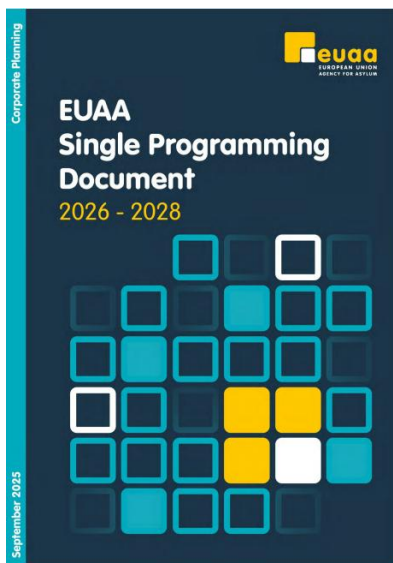
Figure 1: DOCUP 2026-2028

Le document unique de programmation (DOCUP) est l'instrument de programmation institutionnel de l'Agence de l'Union européenne pour l'asile (EUAA) et fait office de décision de financement pour les activités opérationnelles de l'Agence. Il définit la planification annuelle et pluriannuelle des activités et ressources de l'Agence, en assurant la cohérence entre les objectifs stratégiques, les activités opérationnelles et l'allocation des ressources.