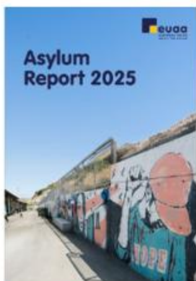
Figure 5: Rapport 2025 sur la situation de l’asile

Grâce aux produits de l’EUAA dans le domaine des connaissances en matière d’asile, les autorités nationales sont mieux à même d’accroître la convergence des décisions en matière de protection internationale, d’accélérer la prise de décision et de renforcer le degré d’uniformité des conditions d’accueil.