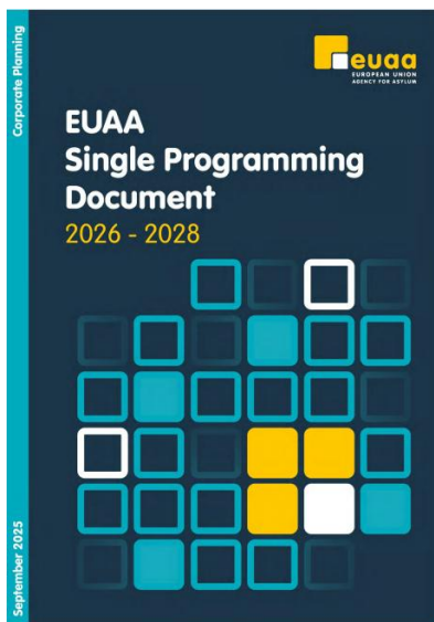
Fíor 1: Doiciméad Clársceidealaithe Aonair 2026-2028

Is é an Doiciméad Clársceidealaithe Aonair ionstraim chlársceidealaithe chorparáideach Gníomhaireacht an Aontais Eorpaigh um Thearmann (EUAA) agus feidhmíonn sé mar chinneadh maoiniúcháin le haghaidh ghníomhaíochtaí oibríochtúla na Gníomhaireachta. Leagtar amach ann pleanáil ilbhliantúil agus bhliantúil na Gníomhaireachta maidir le gníomhaíochtaí agus acmhainní, lena n-áirithítear comhleanúnachas idir cuspóirí straitéiseacha, gníomhaíochtaí oibríochtúla agus leithdháileadh acmhainní.