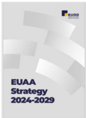
Fíor 2: Straitéis EUAA 2024-2029

Tá an Doiciméad Clársceidealaithe Aonair ar aon dul le tosaíochtaí beartais 2024-2029 an Choimisiúin Eorpaigh i réimse na himirce agus an tearmainn, ag cinntiú comhsheasmhachta le cuspóirí níos leithne an Aontais. Bunaithe ar Straitéis EUAA 2024-2029, sainítear sa chlár oibre ilbhliantúil cuspóirí na Gníomhaireachta i gceithre phríomhréimse gníomhaíochta: tacaíocht oibríochtúil, oiliúint agus forbairt ghairmiúil, eolas ar thearmann, agus gníomhaíochtaí cothrománacha. Bunaítear leis seacht gculpóir straitéiseacha don tréimhse 2026-2028.