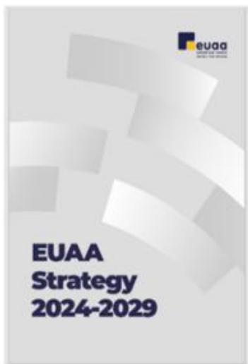
Slika 2: EUAA – Strategija za razdoblje 2024. – 2029.

Jedinstveni programski dokument usklađen je s prioritetima politike Europske komisije za razdoblje 2024. – 2029. u području migracija i azila, čime se osigurava usklađenost sa širim ciljevima EU-a. Na temelju strategije Agencije za razdoblje 2024. – 2029., višegodišnjim programom rada utvrđeni su ciljevi Agencije u četiri glavna područja aktivnosti, a to su: operativna podrška, osposobljavanje i stručno usavršavanje, znanje o azilu te horizontalne aktivnosti. Za razdoblje 2026. – 2028. utvrđeno je sedam strateških ciljeva.