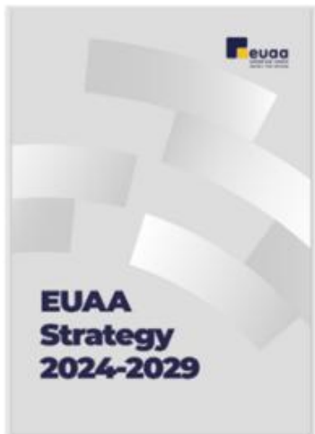
Illustrazzjoni 2: Strateġija tal-EUAA għall-2024-2029

L-SPD huwa allinjat mal-prijoritajiet ta' politika tal-Kummissjoni Ewropea għall-2024-2029 fil-qasam tal-migrazzjoni u tal-ażil, filwaqt li jiżgura l-koerenza mal-oġġettivi usa' tal-UE. Abbażi tal-Istrateġija tal-EUAA għall-2024-2029, il-programm ta' ħidma pluriennali jiddefinixxi l-oġġettivi tal-Aġenzija f'erba' oqsma prinċipali ta' attività: l-appoġġ operattiv, it-taħriġ u l-iżvilupp professjonali, l-għarfien dwar l-ażil, u l-attivitajiet orizzontali. Jistabbilixxi seba' oġġettivi strateġiċi għall-perjodu tal-2026-2028.