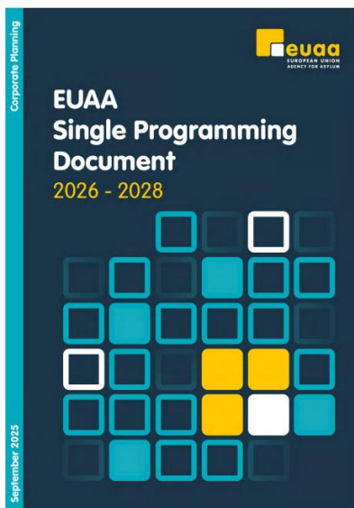
Illustrazzjoni 1: SPD 2026-2028

Id-Dokument Uniku ta' Programmazzjoni (SPD) huwa l-istrument korporattiv ta' programmazzjoni tal-Aġenzija tal-Unjoni Ewropea għall-Ażil (EUAA) u jservi bħala deċiżjoni ta' finanzjament għall-attivitajiet operazzjonali tal-Aġenzija. Jistabbilixxi l-ippjanar pluriennali u annwali tal-Aġenzija għall-attivitajiet u għar-riżorsi, u jiżgura koerenza bejn l-oġettivi strateġiċi, l-attivitajiet operazzjonali u l-allokazzjoni tar-riżorsi.