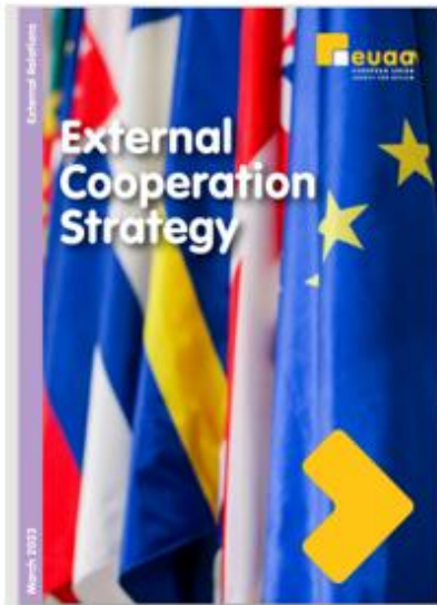
Figuur 6: EUAA-Strategie voor externe samenwerking

Goed bestuur blijft centraal staan in het streven naar bestuurlijke excellentie. Het EUAA zal de internecontrolesystemen, de strategische planning en verslaglegging alsook de beheers- en evaluatieprocessen blijven versterken.