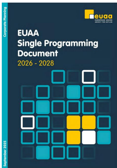
Figuur 1: EPD 2026-2028

Het enkelvoudig programmeringsdocument (EPD) is het institutionele programmeringsinstrument van het Asielagentschap van de Europese Unie (EUAA) en dient als financieringsbesluit voor de operationele activiteiten van het Agentschap. In het EPD wordt de meerjarige en jaarlijkse planning van activiteiten en middelen van het Agentschap uiteengezet, waarbij wordt gezorgd voor samenhang tussen strategische doelstellingen, operationele activiteiten en de toewijzing van middelen.