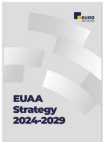
Figuur 2: EUAA-strategie 2024-2029

Het EPD is afgestemd op de beleidsprioriteiten van de Europese Commissie voor 2024-2029 op het gebied van migratie en asiel, om de samenhang met bredere EU-doelstellingen te waarborgen. Op basis van de EUAA-strategie 2024-2029 worden in het meerjarig werkprogramma de doelstellingen van het Agentschap vastgelegd voor vier belangrijke werkterreinen: operationele ondersteuning, opleiding en professionele ontwikkeling, kennis op het gebied van asiel, en horizontale activiteiten. In het werkprogramma worden zeven strategische doelstellingen voor de periode 2026-2028 vastgesteld.