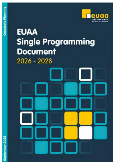
Rysunek 1: Jednolity dokument programowy na lata 2026–2028

Jednolity dokument programowy jest głównym instrumentem programowym Agencji Unii Europejskiej ds. Azylu (EUAA) i stanowi podstawę decyzji o finansowaniu działań operacyjnych Agencji. Określono w nim wieloletnie i roczne planowanie działań i zasobów Agencji, z zachowaniem spójności między celami strategicznymi, działaniami operacyjnymi i podziałem zasobów.