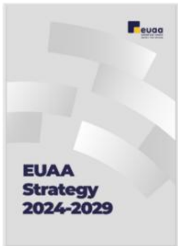
Figura 2: Strategia EUAA pentru perioada 2024-2029

DUP este aliniat priorităților de politică ale Comisiei Europene pentru perioada 2024-2029 în domeniul migrației și azilului, asigurând coerența cu obiectivele mai ample ale UE. Pe baza Strategiei EUAA pentru perioada 2024-2029, programul de lucru multianual definește obiectivele agenției în patru domenii principale de activitate: sprijin operațional, formare și dezvoltare profesională, cunoștințe în materie de azil și activități orizontale. DUP stabilește șapte obiective strategice pentru perioada 2026-2028.