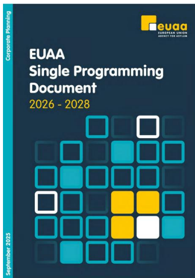
Figura 1: DUP 2026-2028

Documentul unic de programare (DUP) este instrumentul instituțional de planificare corporativă al Agenției Uniunii Europene pentru Azil (EUAA) și servește drept decizie de finanțare pentru activitățile operaționale ale agenției. DUP stabilește planificarea multianuală și anuală a activităților și resurselor agenției, asigurând coerența între obiectivele strategice, activitățile operaționale și alocarea resurselor.