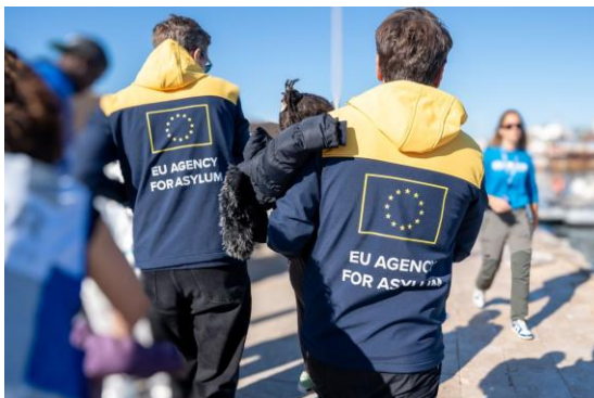
Slika 3: Operativna podpora agencije EUAA na Lampedusi

S sprejetjem zakonodajnih predlogov v okviru pakta se od agencije pričakuje, da bo še naprej precej operativno prisotna, hkrati pa v okviru razpoložljivih virov razširila obseg svojih nalog.