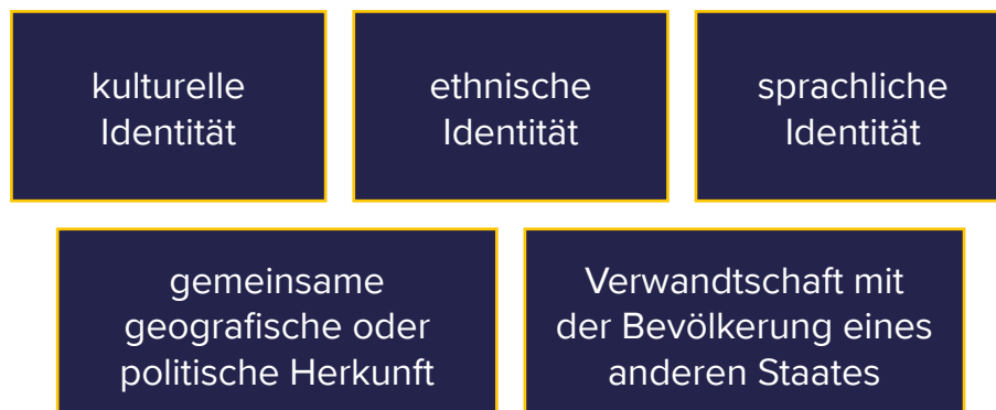
Abbildung 3. (Nicht erschöpfende) Aufstellung der Komponenten der „Nationalität“ als Verfolgungsgrund

In der StatusVO wird klargestellt, dass die Nationalität als Verfolgungsgrund die Staatsangehörigkeit im rechtlichen Sinne umfasst, d. h. die formale Staatsbürgerschaft oder deren Fehlen. So greift dieser Verfolgungsgrund beispielsweise sowohl in Fällen, in denen eine Person nicht die „uneingeschränkte Staatsbürgerschaft“ ihres eigenen Landes genießt und im Hinblick auf ihre bürgerlichen und politischen Rechte einen untergeordneten Status